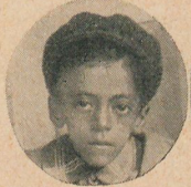
Niños de Urquiza Tucumán