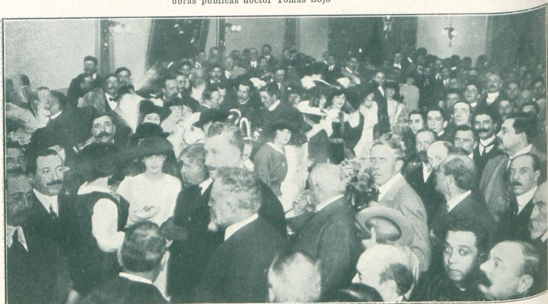
El lunch en la Municipalidad de Dolores