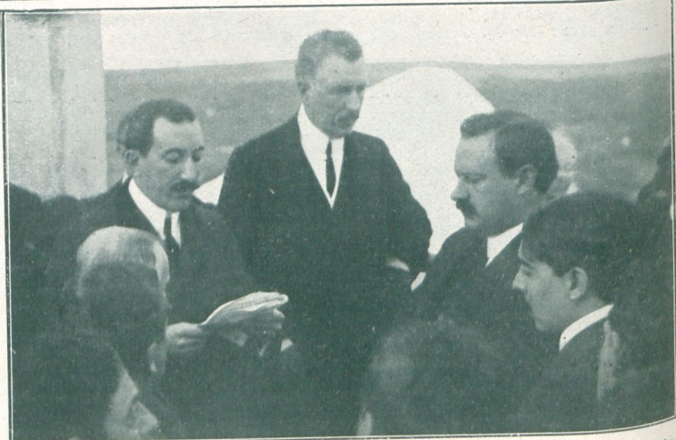
El presidente de la comisión de desagües, señor Uribelarrea, pronunciando su discurso. En el centro el gobernador señor Arana y a su izquierda el ministro de obras públicas doctor Tomás Sojo

El viernes se llevó a cabo la inauguración de los canales de la zona inundable al sur del río Salado. Asistieron el gobernador Arana, los ministros de obras públicas y hacienda, doctores Sojo y Echagüe, y el presidente y los miembros de la comisión de desagües. Los canales visitados fueron los números 2, 1 y 9, efectuándose la ceremonia inaugural en el puente de La Picaza. El gobernador y comitiva fueron obsequiados con un lunch en la municipalidad de Dolores.